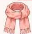
ผ้าพันคอผืนบาง