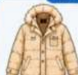
เสื้อโค้ทกันหนาว ตัวหนา