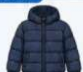
เสื้อขนเป็ด