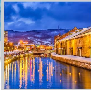
"OTARU CANAL FEST"