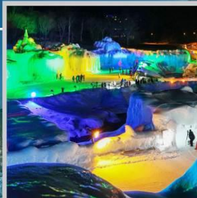
"SOUNKYO ICE FEST"