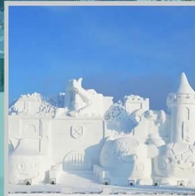
"ASAHIKAWA SNOW FEST"