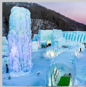
"LAKE SHIKOTSU FEST"