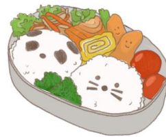
● อาหารสำหรับเด็ก ( 2-11 ปี ) *วัตถุประสงค์ขึ้นอยู่กับทาว์ราน