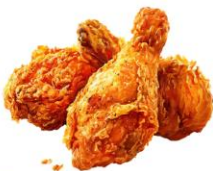
● เนื้อสัตว์ปีก (ไก่)