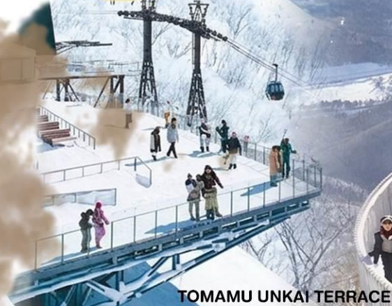
TOMAMU UNKAI TERRACE