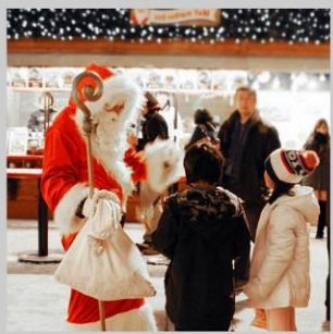
“ODORI GERMAN MARKET”