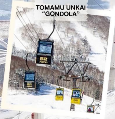
TOMAMU UNKAI “GONDOLA”