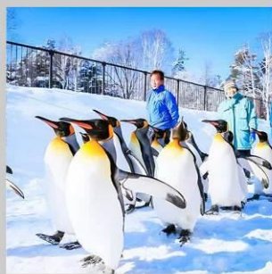
“PENGUIN ASAHIYAMA ZOO”