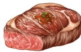
● เนื้อหมู