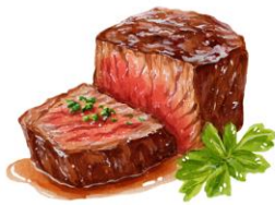
● เนื้อวัว

ขอความกรุณาแจ้งวัตถุประสงค์ที่ท่าน แพ้หรือไม่สามารถรับประทานได้