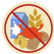
● แพ้อาหาร / อื่นๆโปรดระบุ