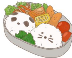
● อาหารสำหรับเด็ก ( 2-11 ปี ) *วัตถุดิบขึ้นอยู่กับทางร้าน