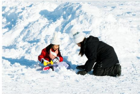
Playing in the snow