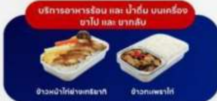
บริการอาหารร้อน และ น้ำดื่ม บนเครื่อง ขาไป และ ขากลับ