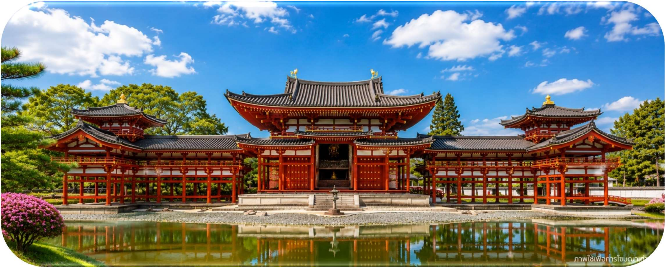
ภาพใช้เพื่อกรรสนวน

จากนั้นอิสระให้ท่านเดินเล่นบริเวณ ถนนเบียวโดอิน โอโมเตะซันโด ถนนสายชาเขียวชื่อดังที่เต็มไปด้วยร้านอาหาร ร้านขนม คาเฟ่สไตล์ญี่ปุ่น และร้านขายของฝากเรียงรายตลอดสองข้างทาง โดยมีเมนูขึ้นชื่อที่รังสรรค์จาก “อุจิมัทฉะ” ชาเขียวต้นตำรับชื่อดังของเมืองอุจิ ไม่ว่าจะเป็นชอฟต์ครีมมัทฉะ โชบะมัทฉะ ราเมงมัทฉะ เกี้ยวชามัทฉะ หรือทาโกะยากิมัทฉะ ให้ท่านได้เพลิดเพลินกับการลิ้มลองรสชาติชาเขียวแท้แบบต้นตำรับ พร้อมเลือกซื้อขนมและของฝากกลับไปฝากคนทางบ้านตามอัธยาศัย