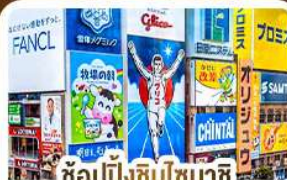
ช้อปปิ้งชินไซบาชิ และโดตงโบริ