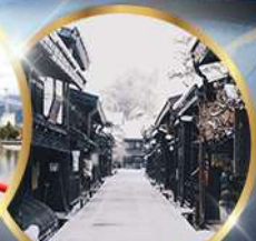
ตากายามา