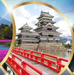
ปราสาทมัตสึโมโตะ