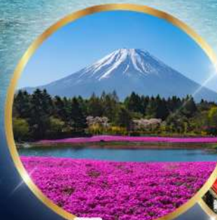
ฟูจิซึบะซากุระ