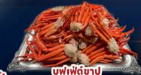
บุฟเฟ่ต์ขาปู