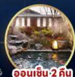
ออนเซ็น 2 คน