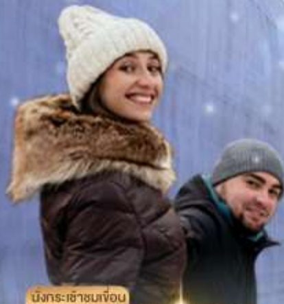
นักรบ-เข้านอนหิมะ