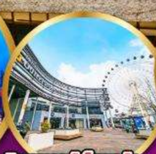
มิตซูเอาท่าเล็ดพาร์ค เซนได