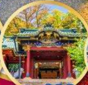
ศาลเจ้าโทโชคุ