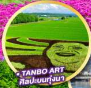
TANBO ART ศิลปะบนทุ่งนา