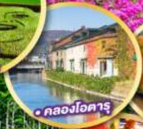
คลองโอดารุ