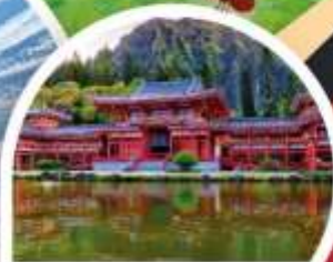
วัดเมียวโดจิน

นาโกย่า ◦ อนุยามะ ◦ ทาคายาม่า ◦ คาบิโคชิ ◦ ทาคายาม่า ◦ ลุจิ ◦ โอซาก้า