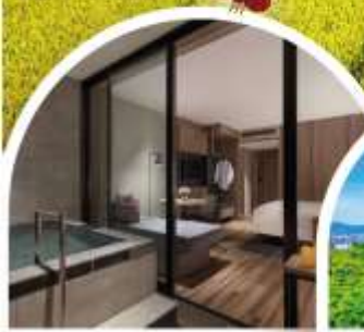
Onsen In Room